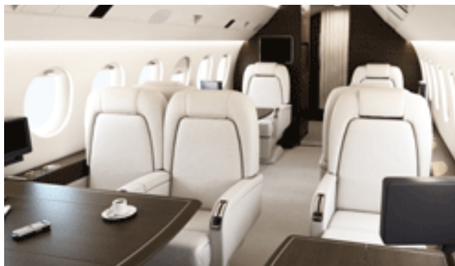
Falcon 2000 Classic

Jet Aviation Basel, аккредитованный центр Dassault Falcon по завершающему оборудованию самолетов, запускает программу “Jet Falcon”. В рамках этой программы владельцы и операторы бизнес джетов Falcon 2000 получают возможность обновить интерьеры своих самолетов. Модернизация салонов Falcon 2000 подразумевает выбор из трех различных дизайнов интерьера салона - Classic, Style и Fashion. Применяя стандартные модули, компания в процессе переоборудования самолета гарантирует минимальный простой воздушного судна, и к тому же реконструкция салона будет довольно выгодной по стоимости.