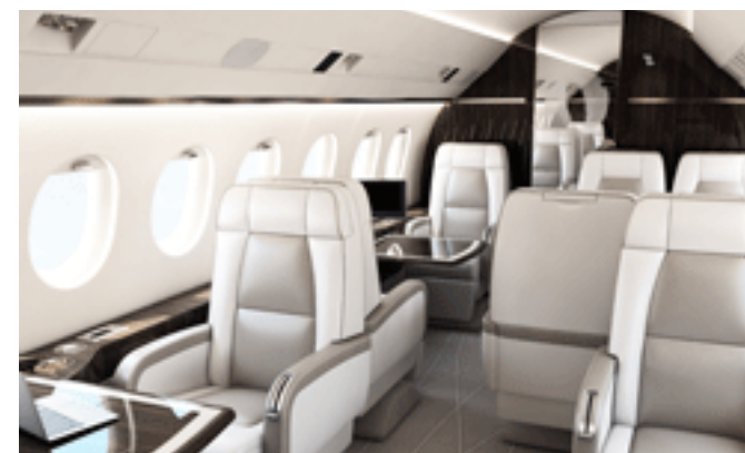
Falcon 2000 Style

Владельцы и операторы, которые рассматривают возможность обновления интерьеров своих F2000, смогут совместить реконструкцию интерьера с