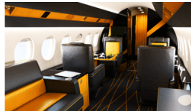
Falcon 2000 Fashion

По словам вице-президента по производству Jet Aviation Basel Бернда Генриха, новая программа реконструкции пассажирского салона “Jet Falcon” предлагает владельцам и операторам Falcon 2000 модернизацию самолетов во время цикла обслуживания по очень конкурентоспособной цене. Кроме того, они могут добавить к вариантам дизайна Classic, Style и Fashion свои индивидуальные предпочтения в интерьер салона.